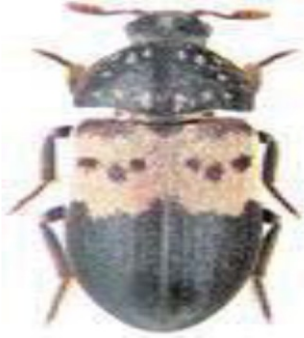
Фото 1. Кожеед ветчинный