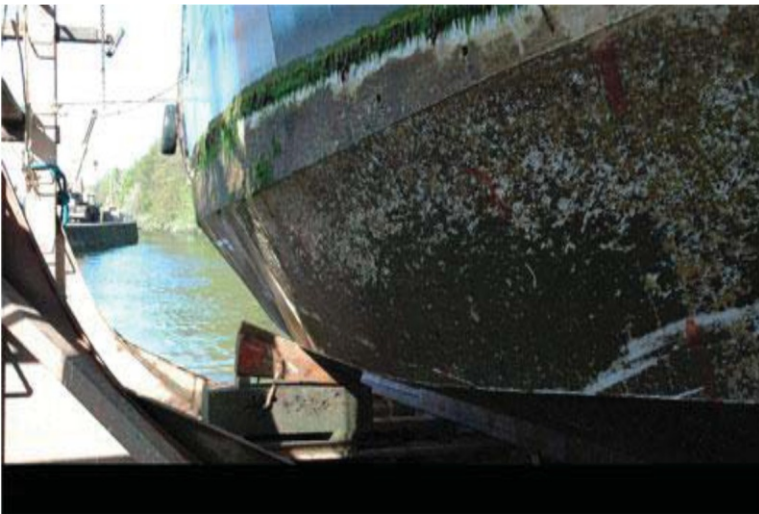
Фото 2. Морское обрастание судов