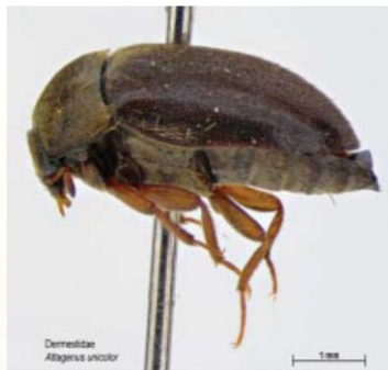
Фото 4. Ковровый кожеед