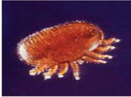
Фото 1. Кошарный клещ