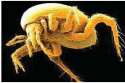
Фото 2. Иксодовый клещ