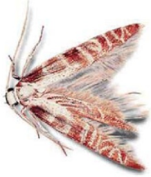
Фото 1. Моль зерновая ( Tineola furciferella )