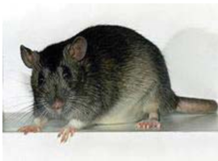
Фото 3. Чёрная крыса