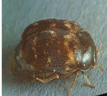
Фото 2. Кожеед меховой