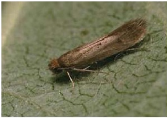
Фото 3. Моль шубная ( Nemapogon personellus )