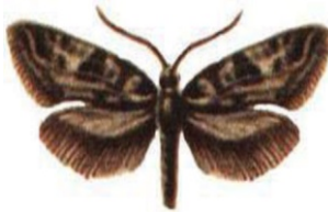
Фото 5. Моль платяная ( Tinea tapetiella L.)