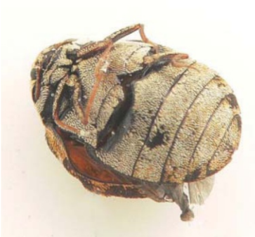
Фото 3. Кожеед музейный