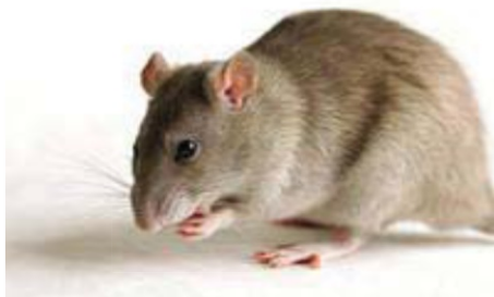
Фото 2. Серая крыса