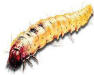
Фото 2. Моль мебельная ( Nemapogon granellus )