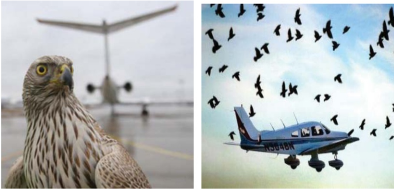
Фото 1. Птицы – источник биоповреждений