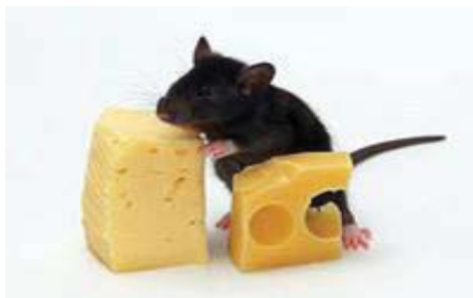
Фото 1. Домовая мышь