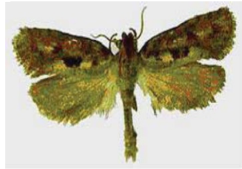
Фото 4. Моль грибная ( Tinea pellionella )