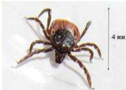
Фото 3. Аргозидный клещ