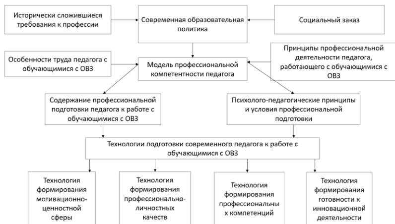
Рис.1.1. Модель профессиональной подготовки педагога, работающего с обучающимися с ОВЗ

Признаки готовности педагога к работе с обучающимися с ОВЗ.